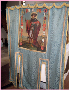
Zunftfahne der Jakobus-Bruderschaft

Unser Himmelreich-Jakobus-Pilgerweg beginnt im staatlich anerkannten Erholungs-ort Hüfingen an der Breg, mit einer denkmalgeschützten Altstadt, im Naturpark Südschwarzwald und im Quellgebiet der Donau. Die Pfarrkirche St. Verena und Gallus wurde erstmals im Jahre 1183 erwähnt. Überreste einer romanischen Apsis sind unter dem Fußboden des Chorraums der Stadtkirche erhalten. Die Kirche wurde 1811 barockisiert. Eine Römische Badruine (70 n.Chr.) sowie das Stadt- und Schulmuseum laden ebenfalls zur Besichtigung ein.